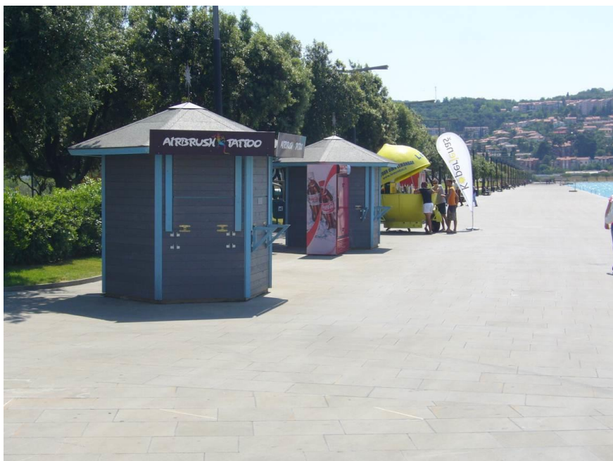
Slika 3: Primer zaprta prodajne hiške, ki je predmet javnega zbiranja ponudb.