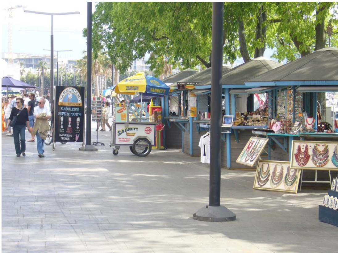
Slika 6: Prodajne hiške na Ukmarjevem trgu