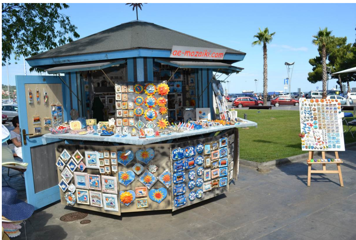
Slika 4: Prodajna hiška na Ukmarjevem trgu in Semedelski cesti - odprta