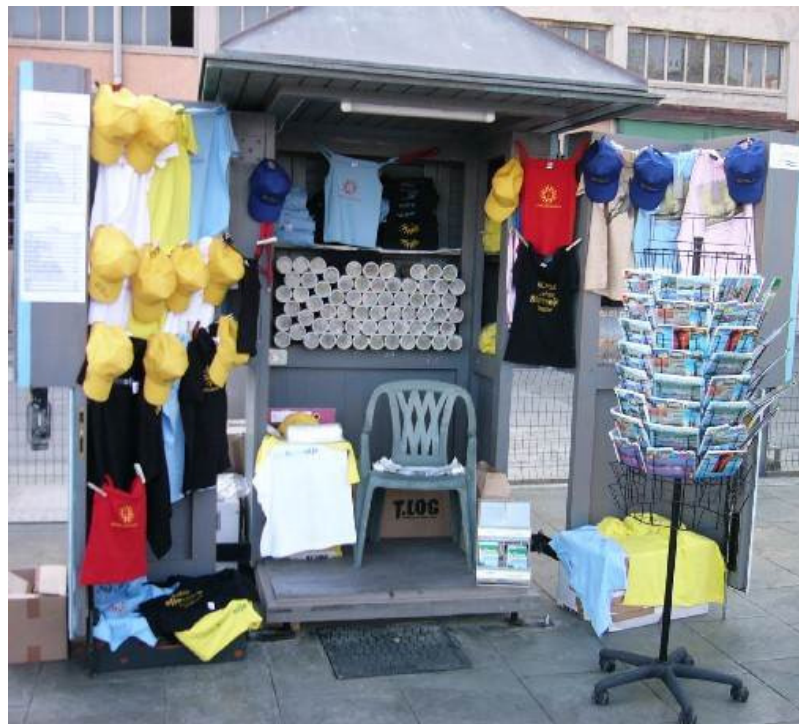
Slika 2: Prodajne hiške na Potniškem terminalu – odprta