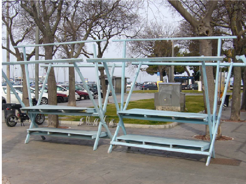
Slika 1: Prodajne stojnice Ukmarjev trg

Definirana javna površina z možnostjo uporabe za izvajanje drugih storitev