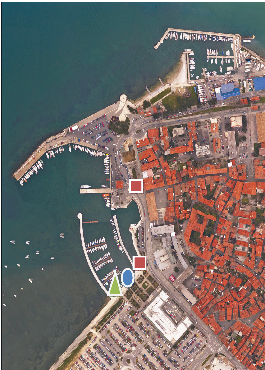
Slika 7: Predpisane lokacije za uporabo delov javnih površin na Ukmarjevem trgu in Smedelski cesti