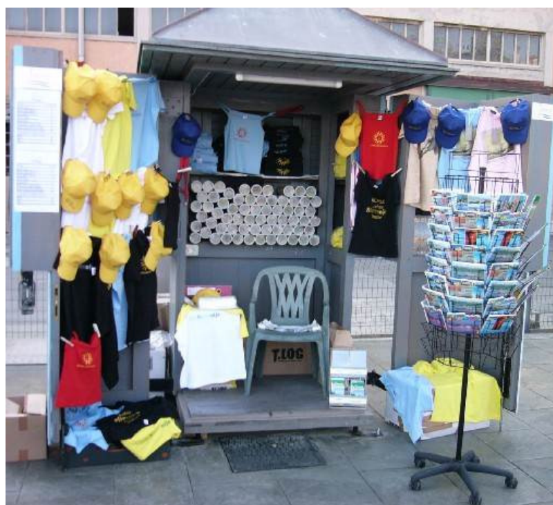
Slika 2: Prodajna hiška na Potniškem terminalu – odprta