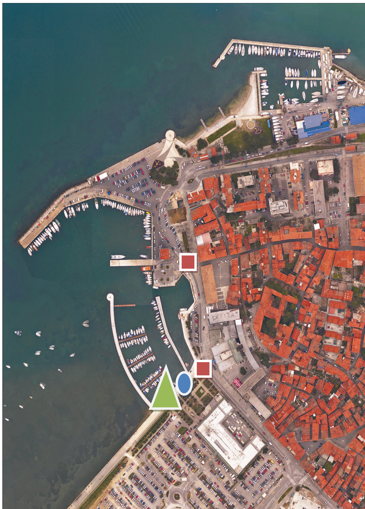
Slika 7: Predpisane lokacije za uporabo delov javnih površin na Ukmarjevem trgu in Smedelski cesti