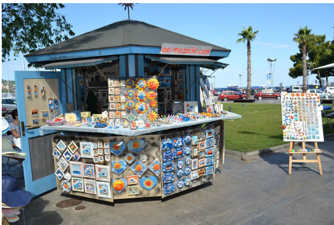
Slika 4: Prodajna hiška na Ukmarjevem trgu in Smedelski cesti - odprta