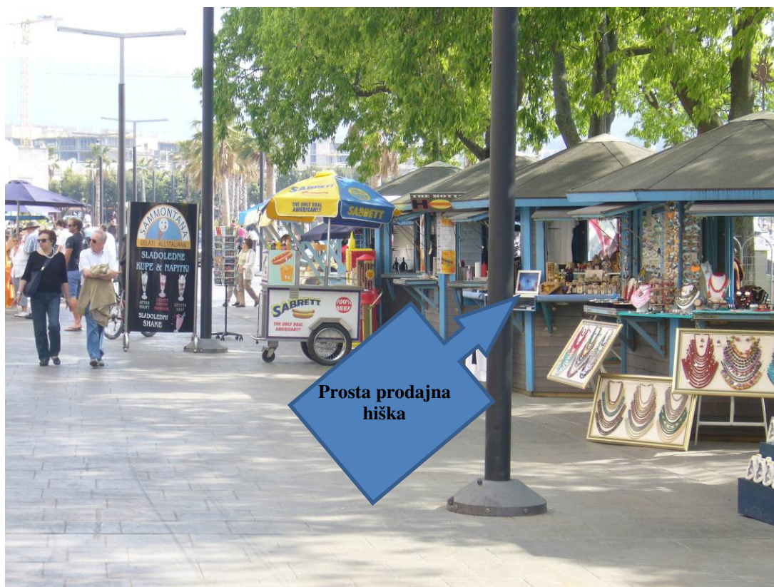
Slika 6: Prosta prodajna hiška na Ukmarjevem trgu