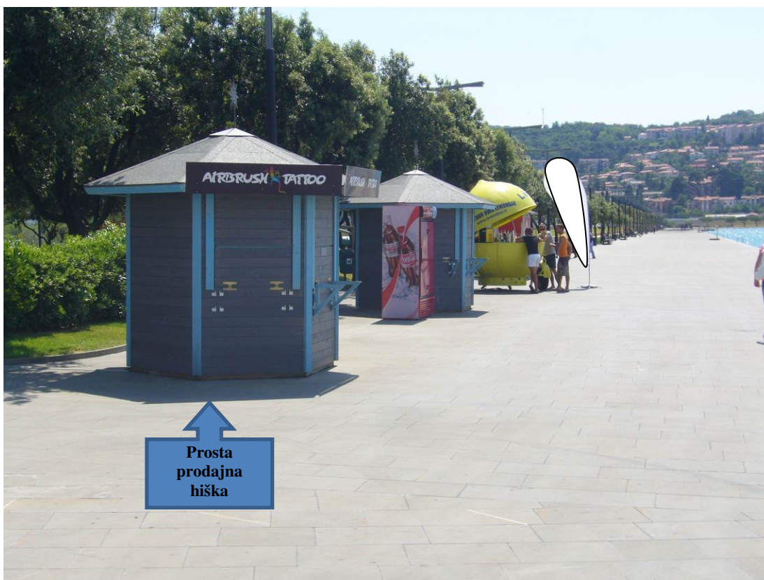
Slika 5: Prosta prodajna hiška na Smedelski cesti