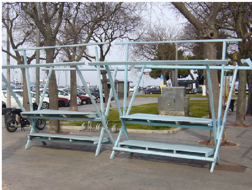
Slika 1: Prodajne stojnice Ukmarjev trg

Definirana javna površina z možnostjo uporabe za izvajanje drugih storitev