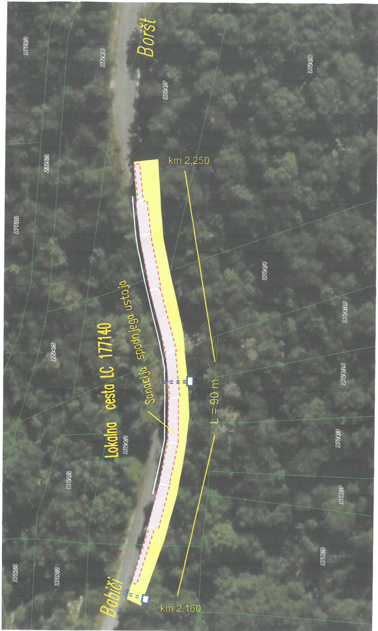
LOKALNA CESTA Babiči - Boršt Sanacija poškodb vozišča ,