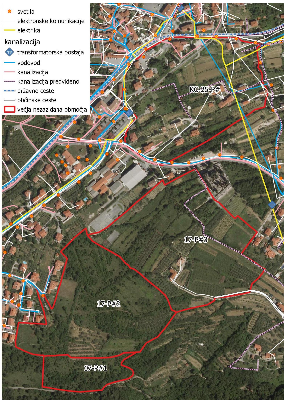
(slika2) Prikaz obstoječe gospodarske javne infrastrukture