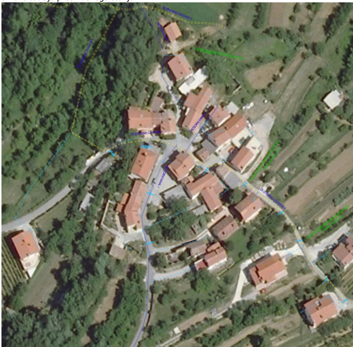
Slika: situacija predvidenega stanja