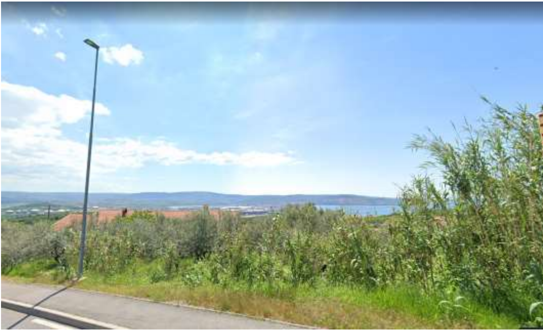
Zajem slike: maj 2023