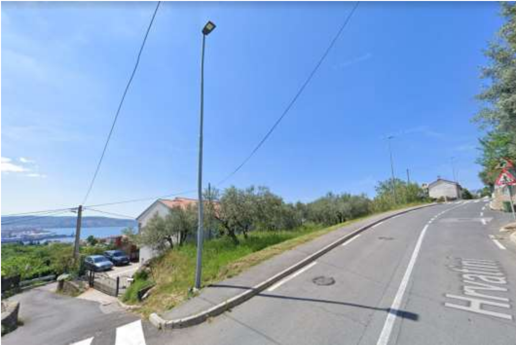
Zajem slike: maj 2023