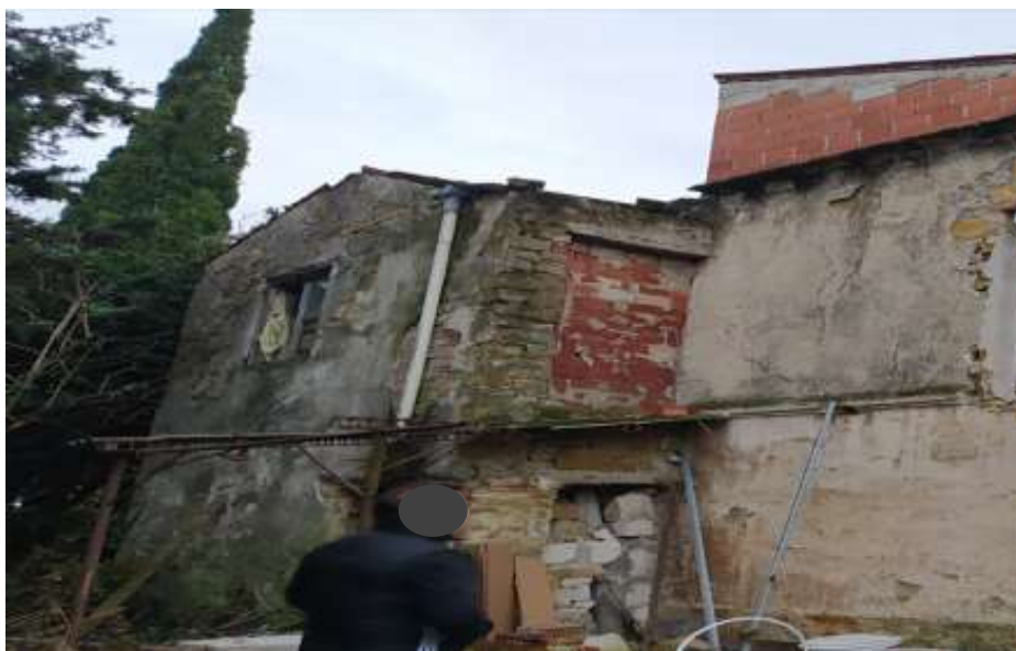
ID 2590-1217/12 k.o. 2590 Hribi