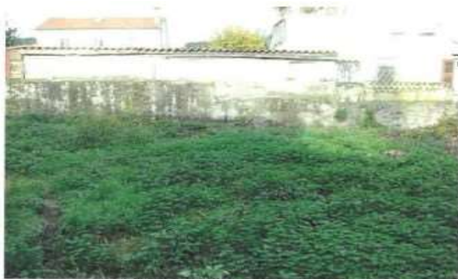
ID 2590-1217/11 k. o. 2590 Hribi