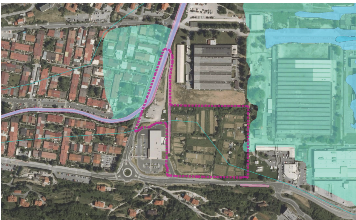
Prikaz poplavnih razredov v območju OPPN