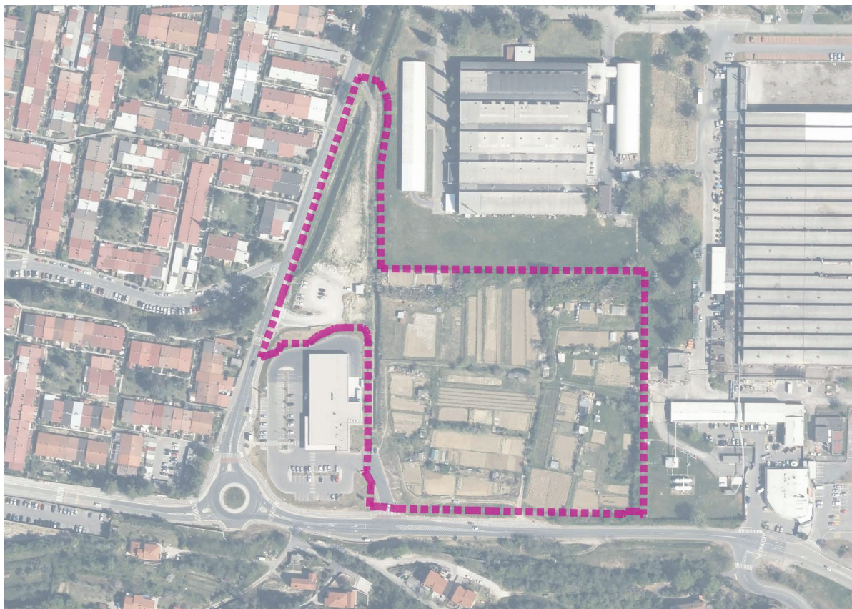
Prikaz območja OPPN v aerofoto posnetku ožjega območja