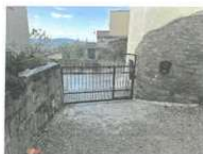
Slika 7: Dostop iz vzhodne strani