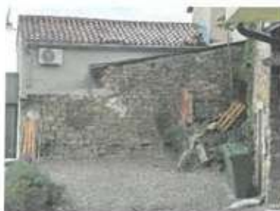
Slika 9: Dvorišče pred objektom