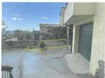
Slika 8: Pogled na dvorišče pred objektom