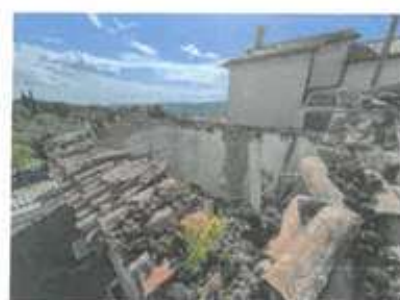
Slika 13: Porušena streha objekta