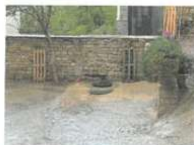
Slika 10: Terasa južno od podpornega zidu