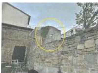
Slika 11: Pogled iz JZ strani