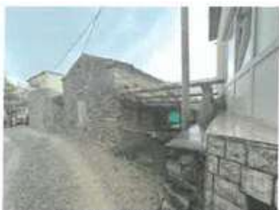
Slika 5: Severna stena objekta in nadstrešek