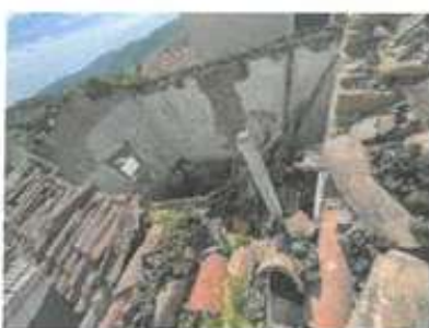
Slika 12: Pogled v notranjost objekta