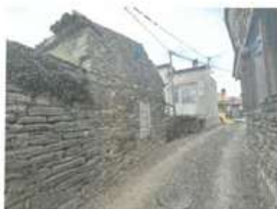
Slika 6: Dostop iz severne strani