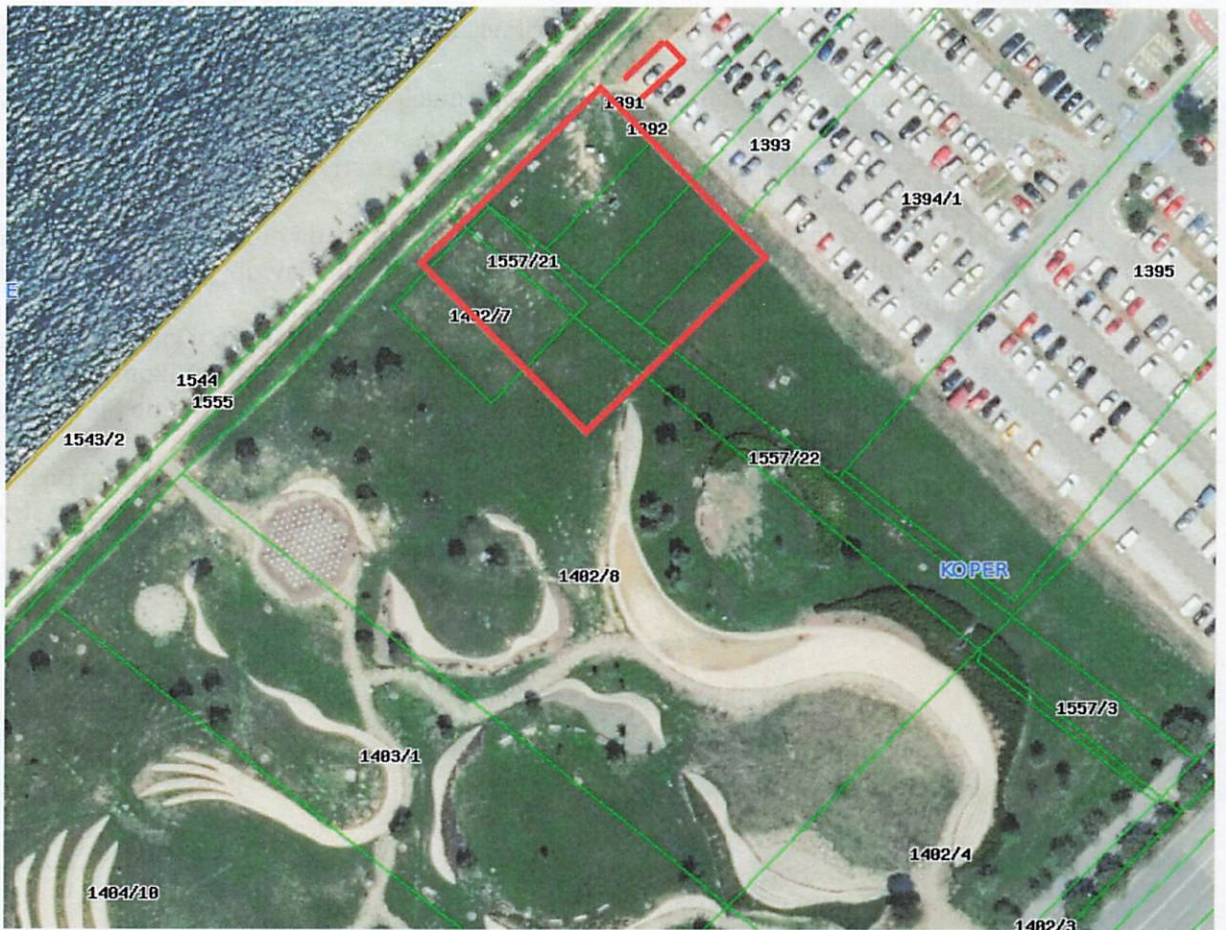
Slika 1: Del javne površine, ki je predmet javne dražbe